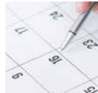
FREQUENTIE VAN HET ONDERHOUD