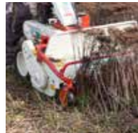
DRIE M's MAAIEN, MESTEN, MULCHEN