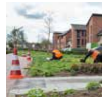
TRADITIONEEL IDEEËN BESPREKEN