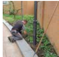
BELANG ADEQUAAT ONDERHOUD