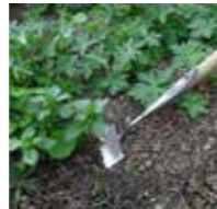
MATERIAAL EN HET GEBRUIK ERVAN